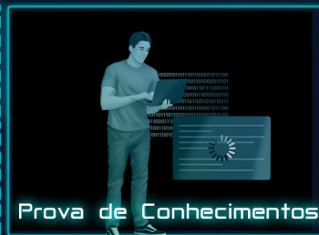
Prova de Conhecimentos